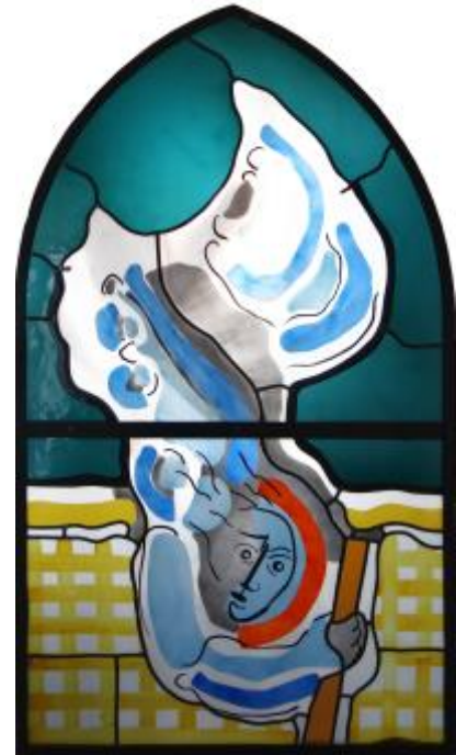
Himmlisches Jerusalem, 2000/2001, Petri-Kirche in Westerwerde

Der Künstler, der annähernd sechs Jahrzehnte die Glasmalerei in Deutschland prägte und für über 350 Gebäude zahllose Fensterentwürfe lieferte, gehört in der glasmalerischen Nachkriegsgeneration zu den großen sieben Glaskünstlern, welche den Weltruf der deutschen Glasmalerei begründeten und ihn bis heute aufrechterhalten.